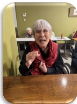
息が続くまでの発声練習です(*´艸)