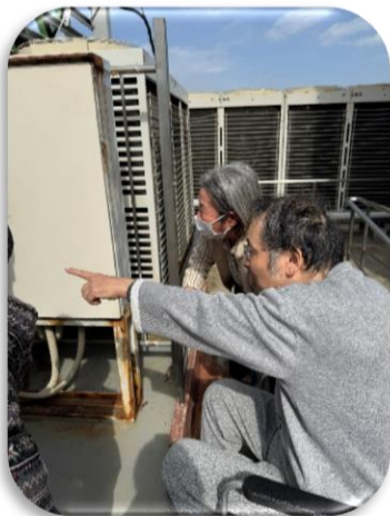
熊本城はアレたいっ♪